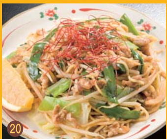
20 春本食堂 650円 ボリュームたっぷりお値段控えめ担々やきそば 湯河原町中央1-1639 TEL / 0465-62-2779 営業時間 / 11:00~19:30 定休日 / 木曜日