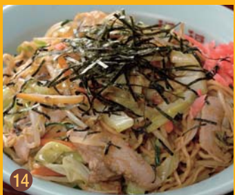
14 福福亭 750円 野菜シャッキリ担々やきそば 湯河原町土肥1-13-1 TEL / 0465-63-2929 営業時間 / 11:00~14:30, 17:00~19:30 定休日 / 日曜日