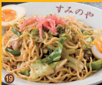
19 すみのや 700円 特製温泉煮玉子付担々やきそば 湯河原町中央1-1637 TEL / 0465-63-4052 営業時間 / 11:00~18:30 定休日 / 木曜日