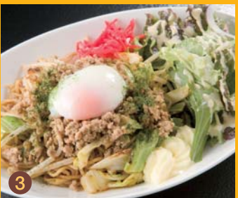
3 喫茶 ポン 800円 ひき肉たっぷり温玉トッピング担々やきそば 熱海市泉35 TEL / 0465-64-2105 営業時間 / 11:00~16:00 定休日 / 水曜日