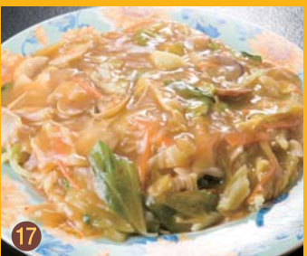
17 ラーメン やっこ 800円 海鮮ピリ辛あんかけ風担々やきそば 湯河原町中央1-6-9 TEL / 0465-63-3935 営業時間 / 11:00~14:00, 18:00~23:00 定休日 / 水曜日、第2火曜日