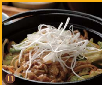
11 一福堂 980円 うま辛たっぷり肉あんかけやきそば 湯河原町土肥1-3-7 TEL / 0465-62-3105 営業時間 / 8:00~18:00 定休日 / 年中無休