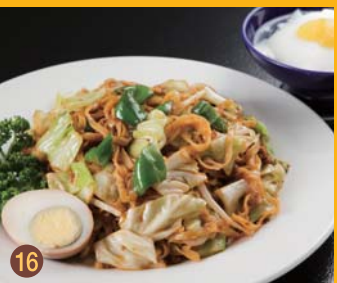
16 紅筏坊 980円 独特の麺、伊府麵を使用 お茶タゴと杏仁豆腐付 湯河原町土肥3-8-10 TEL / 0465-62-8260 営業時間 / 11:30~14:30, 17:30~21:30 定休日 / 不定休