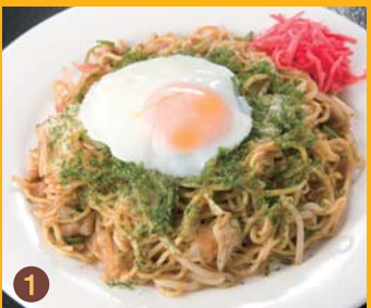
1 喫茶 ごごめの湯 600円 ボリュームたっぷり目玉焼入り担々やきそば 湯河原町宮上562-6 TEL / 0465-63-6944 営業時間 / 平日11:00~18:00 土日祝11:00~19:30 定休日 / 月曜日(祝日の場合は翌日)