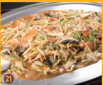
21 高松食堂 650円 見てびっくり、食べてびっくり大盛担々!! 湯河原町中央4-10-2 TEL / 0465-62-5730 営業時間 / 11:30~15:00, 17:00~20:00 定休日 / 日曜日