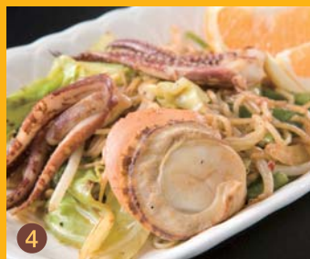
4 東里(とうり) 680円 海の幸担々やきそば 湯河原町宮上732-32 TEL / 0465-63-5766 営業時間 / 11:00~21:00 定休日 / 水曜日

湯河原のご当地グルメ「担々やきそば」。独特の辛みと旨み、コシのある麺が特徴の湯河原ならではの味をご賞味ください!