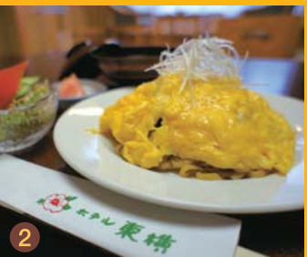
2 ホテル東横(宿泊者限定) 945円 ふんわりオムレツのピリ辛やきそば 熱海市泉226-70 TEL / 0465-62-4141 営業時間 / 12:00~13:00 定休日 / 年中無休