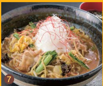
7 食事処 山ごや 840円 自家栽培の野菜でスープ担々やきそば 熱海市東99-1 TEL / 0465-62-4493 営業時間 / 10:00~18:00 定休日 / 火曜日