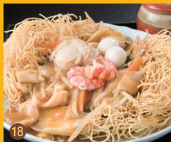
18 らーめん きっせい 850円 揚げ麺の細麺で五目あんかけ風 湯河原町中央1-10-18 TEL / 0465-63-1928 営業時間 / 平日11:30~14:30, 17:00~21:00 定休日 / 金曜日 土日祝11:30~20:00