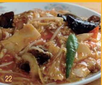
22 昇龍 900円 あんかけ風担々やきそば 湯河原町中央5-14-2 TEL / 0465-64-2520 営業時間 / 11:00~20:30 定休日 / 火曜日