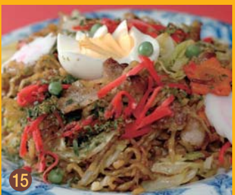
15 餃子ショップ 650円 さくらえび満載担々やきそば 湯河原町土肥2-7-20 TEL / 0465-62-4758 営業時間 / 9:00~19:00 定休日 / 年中無休