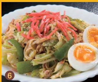
6 和風スナック 寿寿 650円 オーソドックスなソースの担々やきそば 湯河原町土肥6-8-10 TEL / 0465-63-5633 営業時間 / 19:00~1:00 定休日 / 水曜日